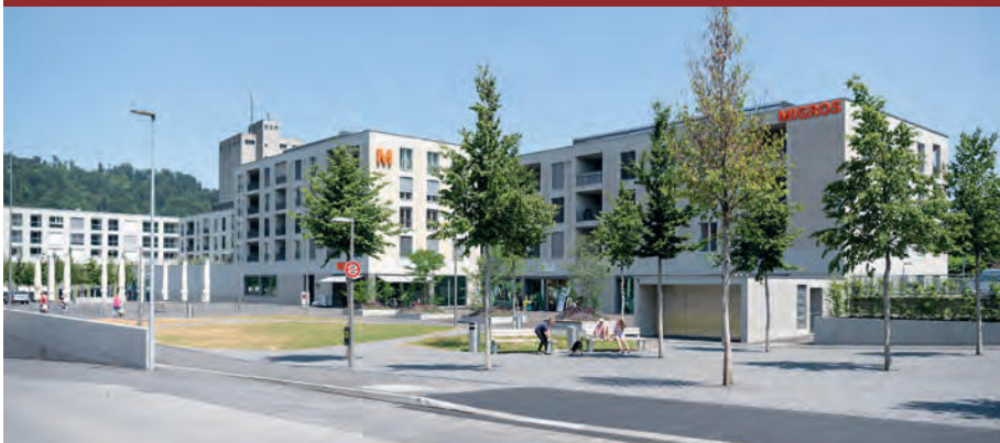
■ Familien, Singles oder Best Ager – die total 50 Wohnungen im Markthof lassen viele Wohnformen zu.